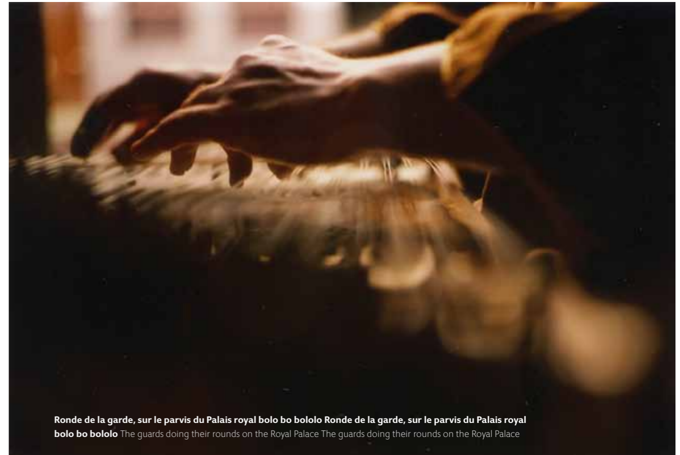
Ronde de la garde, sur le parvis du Palais royal bolo bo bololo Ronde de la garde, sur le parvis du Palais royal bolo bo bololo The guards doing their rounds on the Royal Palace The guards doing their rounds on the Royal Palace