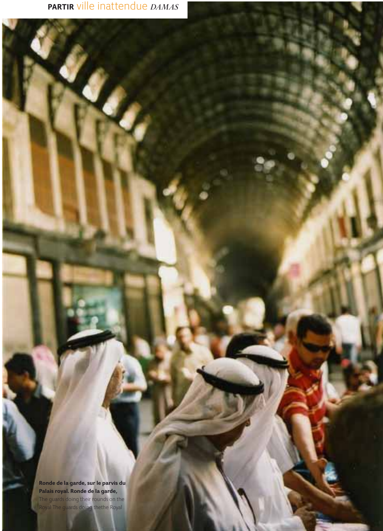
Ronde de la garde, sur le parvis du Palais royal. Ronde de la garde, The guards doing their rounds on the Royal The guards doing thethe Royal

précieuses – bois de noyer, de cédrat et de rose – en une savante géométrie, incruste des fragments de nacre ou d'os de chameau pour composer des meubles uniques. «Ce que m'a enseigné cet art? La patience et la fidélité à ce que l'on tient pour vrai.»